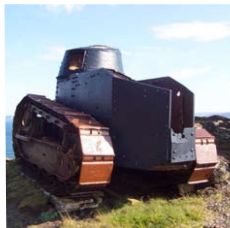
Siste bilder av stridsvognen ble tatt i 2007.

"Tanksen har alltid ligget mitt hjerte nært, og i fjor prøvde jeg å få satt i gang berging av tanksen før den forsvant for godt, både på grunn av vær og vind, men ikke minst suvinirjegere". Det var ikke først og fremst været som hindret Tor Edgar i å pusse opp, men fylkeskommunen nektet han å kjøre ned til stridsvognen da området var på naturfredningstomt. Planen var å frakte stridsvognen til Bodø for oppussing, men det er umulig å gjøre dette uten lastebil og kran. Eneste alternativ var å gjøre jobben på stedet, og det uten å kunne transportere verktøy, maling og andre deler med