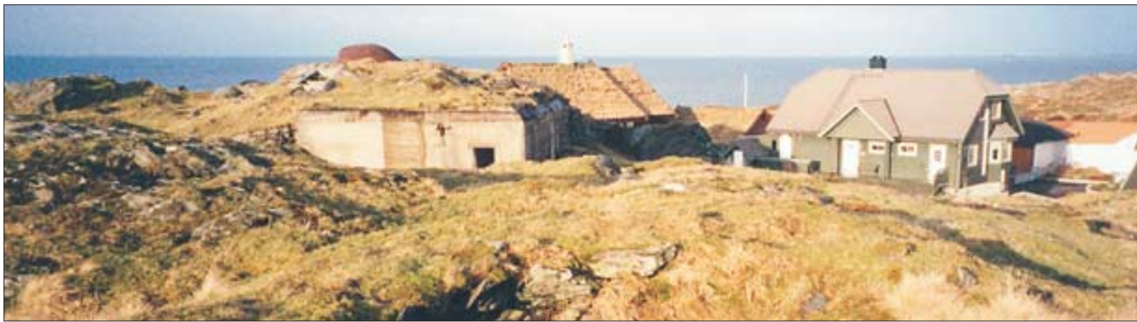
KVALA: Da huset til høyre ble bygd på Sagatun, ble en bunker lagt i grus. Tett ved boligfeltet ligger en bunker av samme slag.