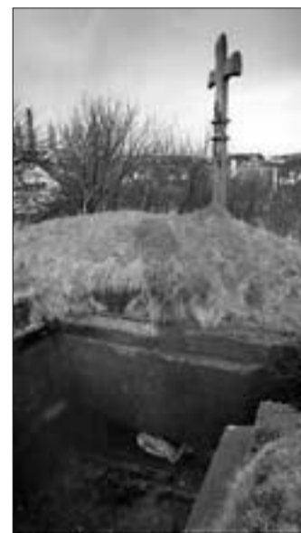
GARD: Bunkeren på Krosshau- gen er der ennå, men tildekket.