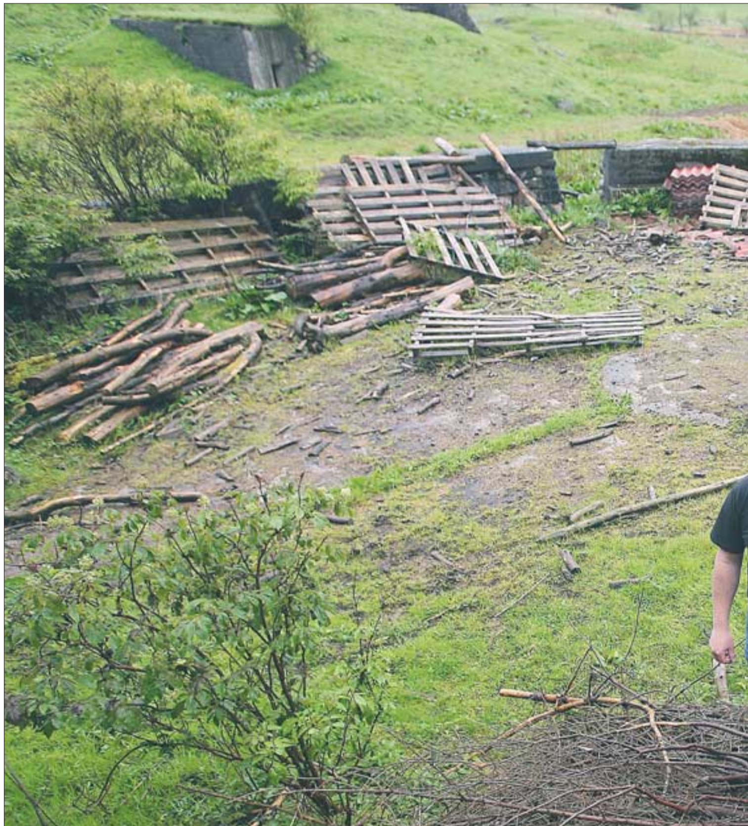
SKAL VEKK: Mangt er krigsminne framstår i dag som rene søppelplasser. Kanskje er det derfor reguleringsplanleggerne ikke har sett at dette er den mest tomt, mens de to tilhørende bunkerne i bakgrunnen bevares, mener han.

Et helt lite samfunn ble bygget opp rundt de største forlegningene; det fantes både kjøkkenbrakke og spisesal, grisehus og stall, sykehus og