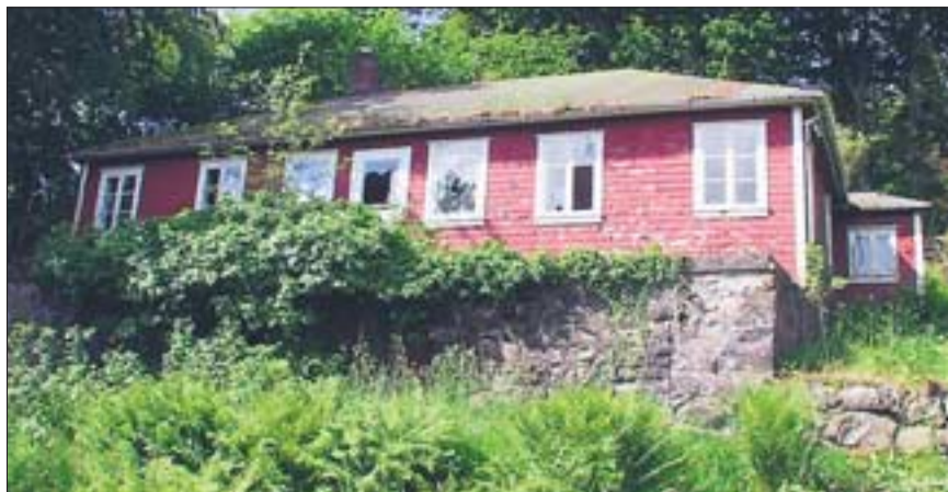
EIKJEHAMMER: Den siste tyskerbrakkka skulle vernes, men ble likevel revet.