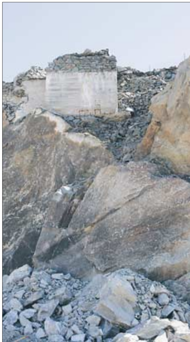
NESET, SKUDENESHAVN: Bevaringsverdig bunker henger på kanten av stupet.