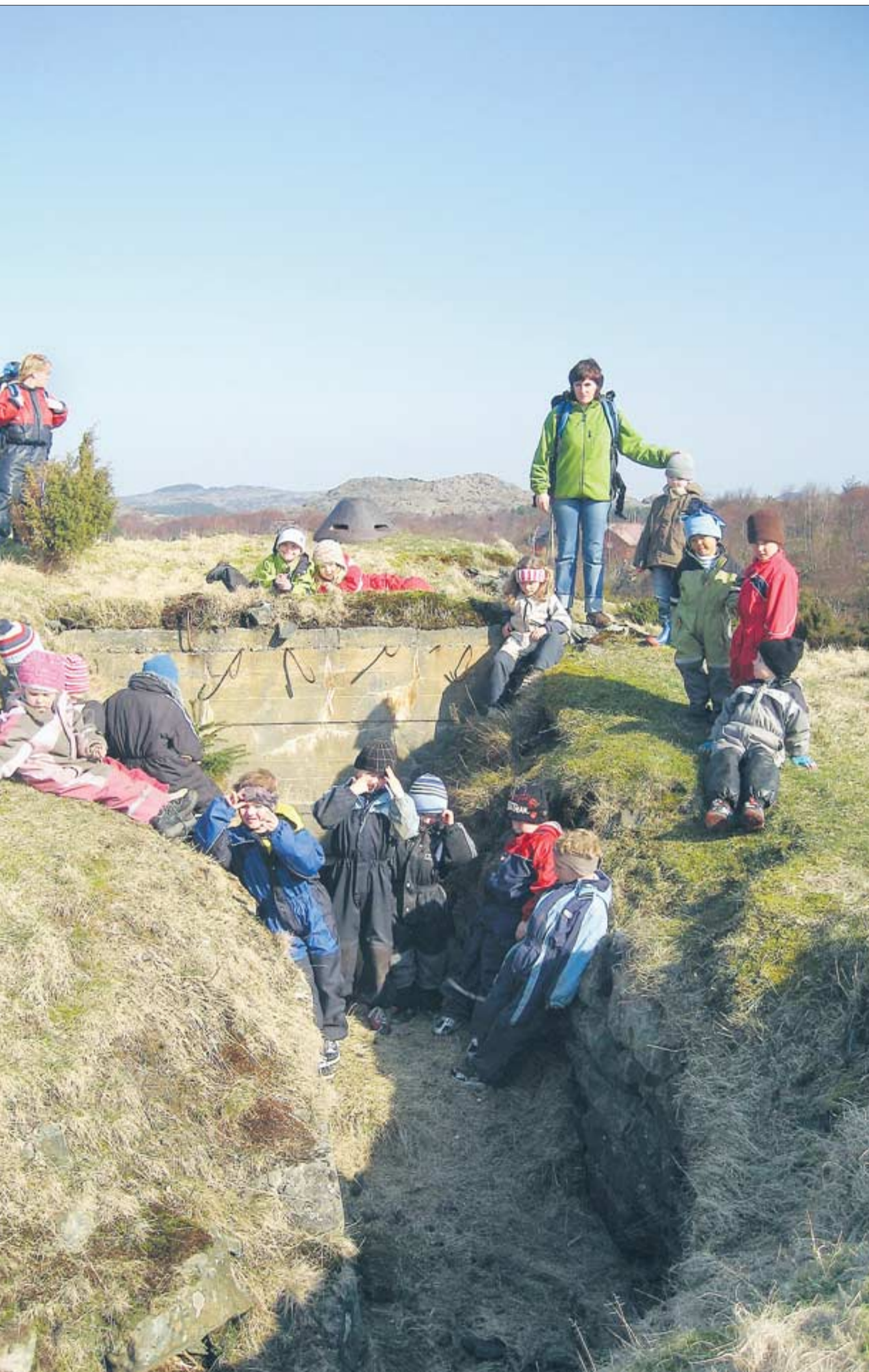
PÅ TUR: Ekrene Natur- og Gårdsbarnehage i Sveio bruker ofte området rundt kommunegrensen på Vikse til lek og turmål. Barna synes bunkerne er spennende. Kanskje lærer de at den lille metallkuppelen i bakgrunnen er toppen på en infanteriobservasjonskuppel av typen 90P9, den eneste som finnes på Haugalandet. Inni her sto en tysk soldat og fulgte med alt som foregikk i området, med utsikt også til sjøs.