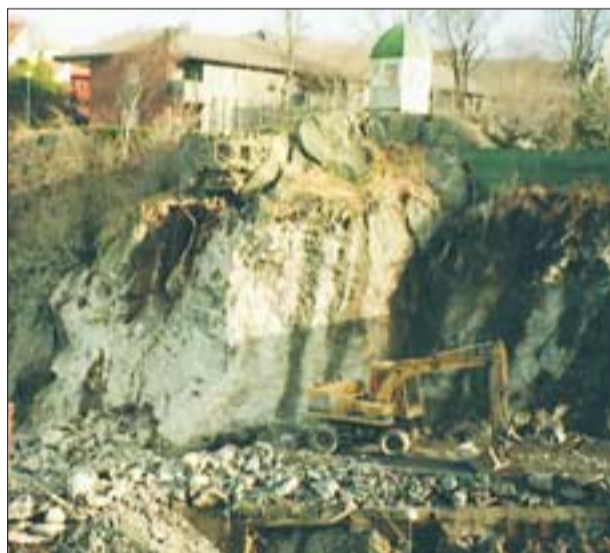
HAVNABERG: Mange ønsket å bevare den særpregede bunkeren med kontroll over Hasseløybrua.