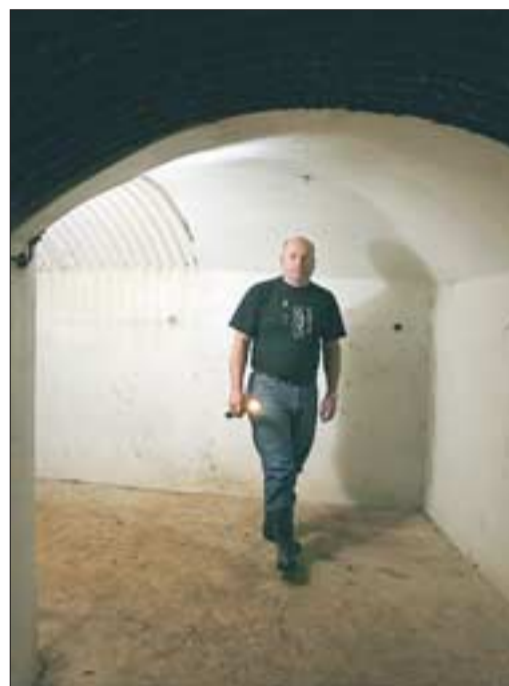
ROMSLIG: Ildledningssentralen er formet som en om lag 70 meter lang U, hvitkalkede vegger og god plass.

«... videre boligbygging i området. Men vi kom ikke inn i bildet før velforeningen kontaktet oss, sier han.