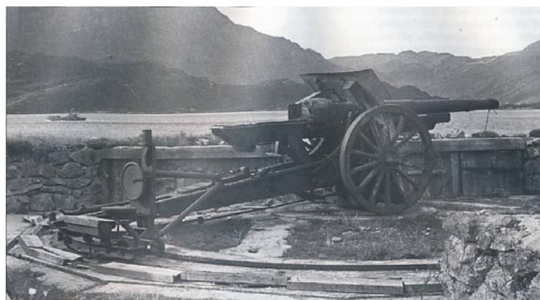
10,5 cm K331(f) på standard dreieskive.

German coastal defence in Norway during WW II