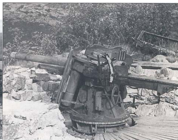
10,5 cm K331(f) ombygd til sokkelaffutasje. Også brukt av Kystartilleriet frem til 1958.

Bilde fra side 243 i boken "Fjeld, Odd T.: "Klar til strid", Kystartilleriet gjennom århundrene, utgitt av Kystartilleriets Offisersforening, Oscarsborg 1999, ISBN 82-995208-0-0 (Vestfold Fylkesbibliotek q359 K). Bildet kan meget godt være tatt på Flatset.