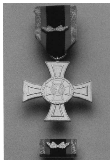
Det har stått strid om den første tyske tapperhetsmedaljen. "Ehrenkreuz der Bundeswehr für Tapferkeit".

For CDU er medaljene et bidrag til å skape en mer positiv profil for Bundeswehr, gjennom en normalisering av tysk deltakelse i internasjonale operasjoner. I samme retning peker opprettelsen