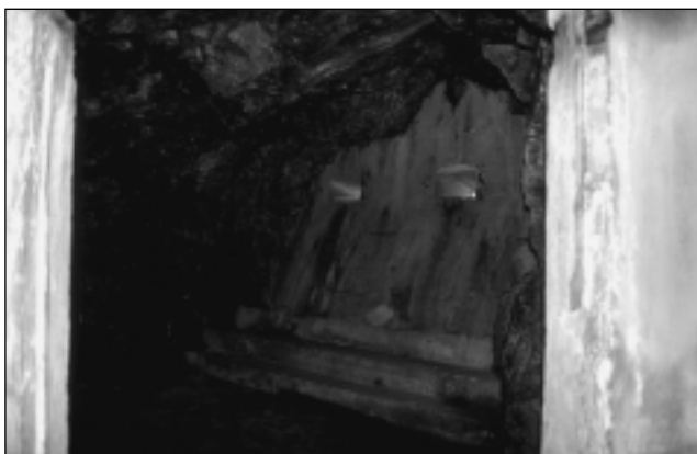
Fjellanleggets interiør, skyteskårene mot Glomma