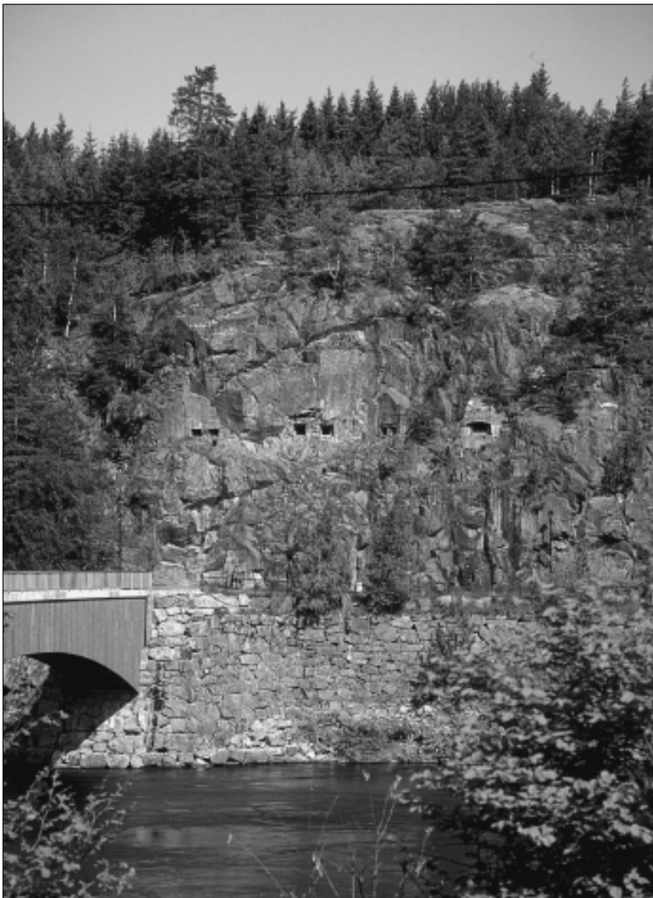
Brogalleriets skyteskår kontrollerte veibroen over Glomma