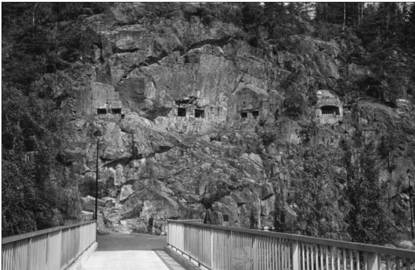
Fjellveggen skyteskår sett fra broen.

Vernet omfatter fjellanlegget, murkonstruksjoner, voller, veier og alle spor etter militær aktivitet innenfor angitt område.