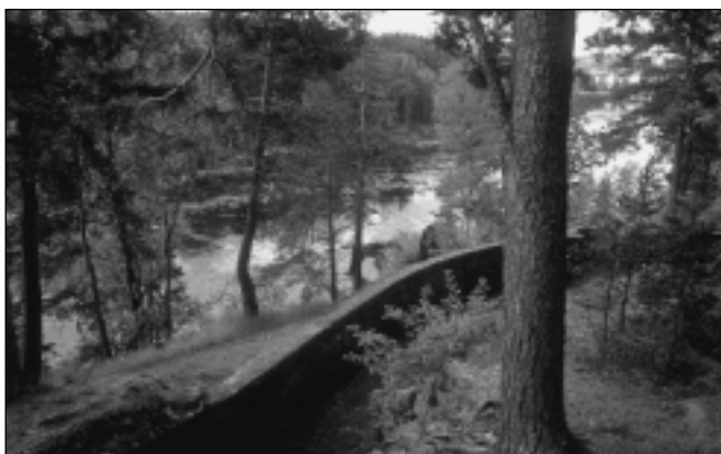
Fossum brogalleri, inngangspartiet med betongmuren og utsyn over Glomma