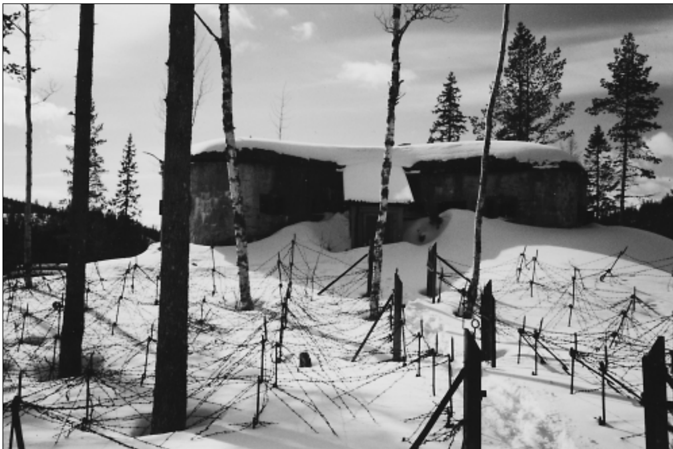
Fortet består av ett blokkhus og to fjellgallerier. Blokkhuset er godt bevart med opprinnelige piggtrådsperringer.

Vaterholmen leir befinner seg innenfor et begrenset område på nordsiden av elva, hvorav fem bygninger ligger spredt langs riksvei 72, mens de resterende bygninger danner et kjerneområde ved en sidevei til riksveien. Forlegningsleiren ble oppført i perioden 1917–20, men har enkelte bygninger av nyere dato. Leiren som helhet framstår som svært endret.