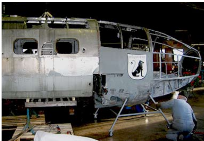
Et meget sjeldent vrak: Heinkel He 111H-3. Her er restaureringsarbeidet i gang i Varberg i Sverige.